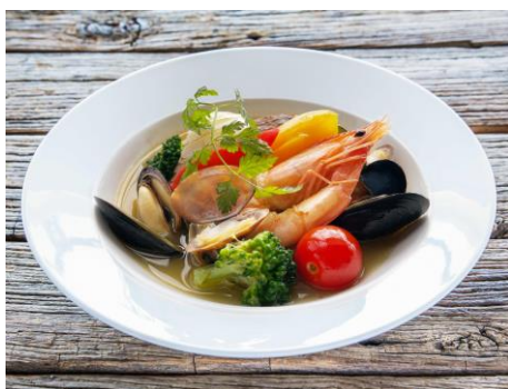
（左）コース料理「海の幸のブイヤベース」