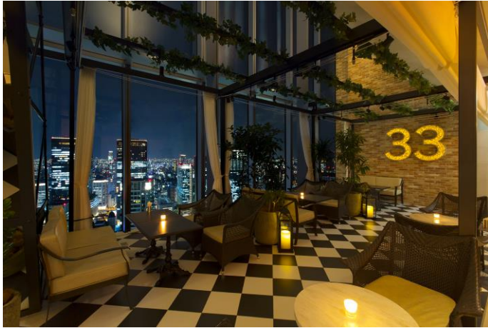
※店内の様子と夜景

※事前予約制となります。各回 9 組様限定となりますので、お早めにご予約ください。