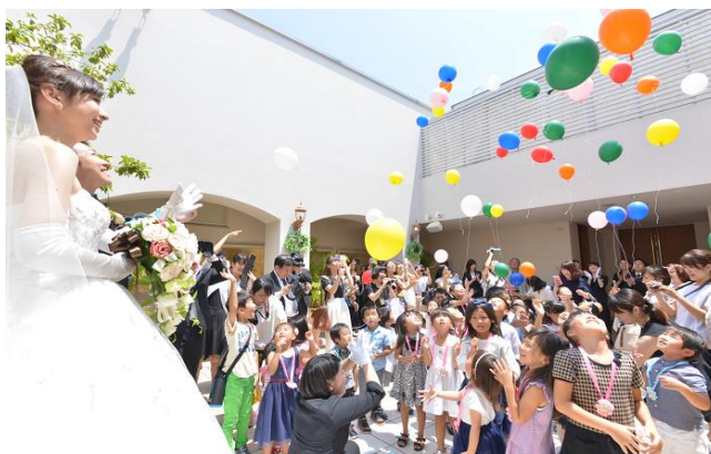
（写真：2016 年開催「キッズウェディングパーティー」）